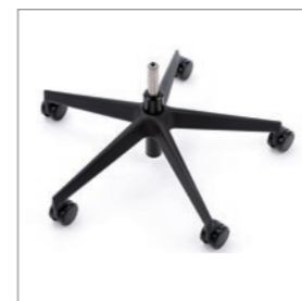
Drehkreuz Schwarz Kunststoff