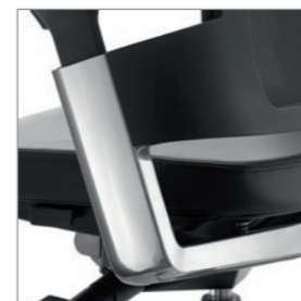
Armlehnenräger Aluminium poliert