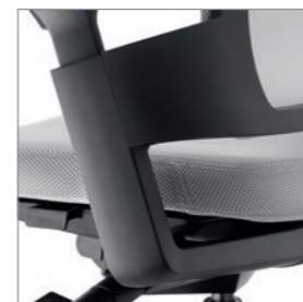
Armlehnenräger Schwarz matt Aluminium