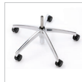
Drehkreuz Aluminium poliert