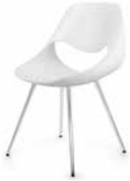
Aluminium Aluminium Aluminium