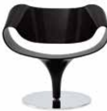
Deckend lackiert Opaque lacquered Laque couvrante