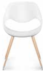
Holz Wood Bois