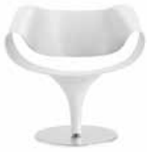
Kunststoff lackiert Plastic lacquered Polyamide laqué