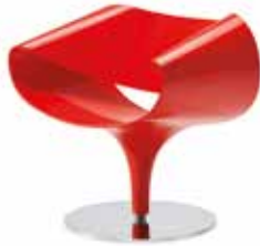
Deckende UV-beständige Lackierung Opaque UV-resistant lacquered finish Laque couvrante résistante aux UV