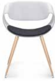
Mit Sitzpolster With seat cushion Avec capitonnage d'assise