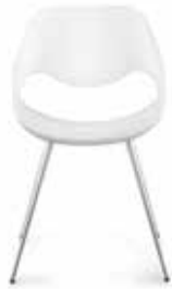
Kunststoff Plastic Polyamide