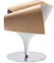
Holz innen mit weisser CPL Folie belegt Wood: inner surface covered with white CPL film Bois: surface intérieure avec film CPL blanc