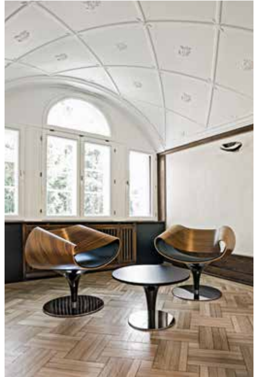
Rechtsanwaltskanzlei Mutschke (Bielefeld, Deutschland) Mutschke Law Firm (Bielefeld, Germany) Cabinet d'avocats Mutschke (Bielefeld, Allemagne)