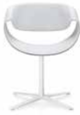
Fusskreuz Cross base Piétement étoile