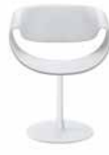
Tellerfuss Circular base Disque