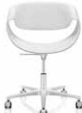
Rollen Castors Roulettes