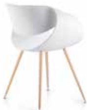
Holz Wood Bois