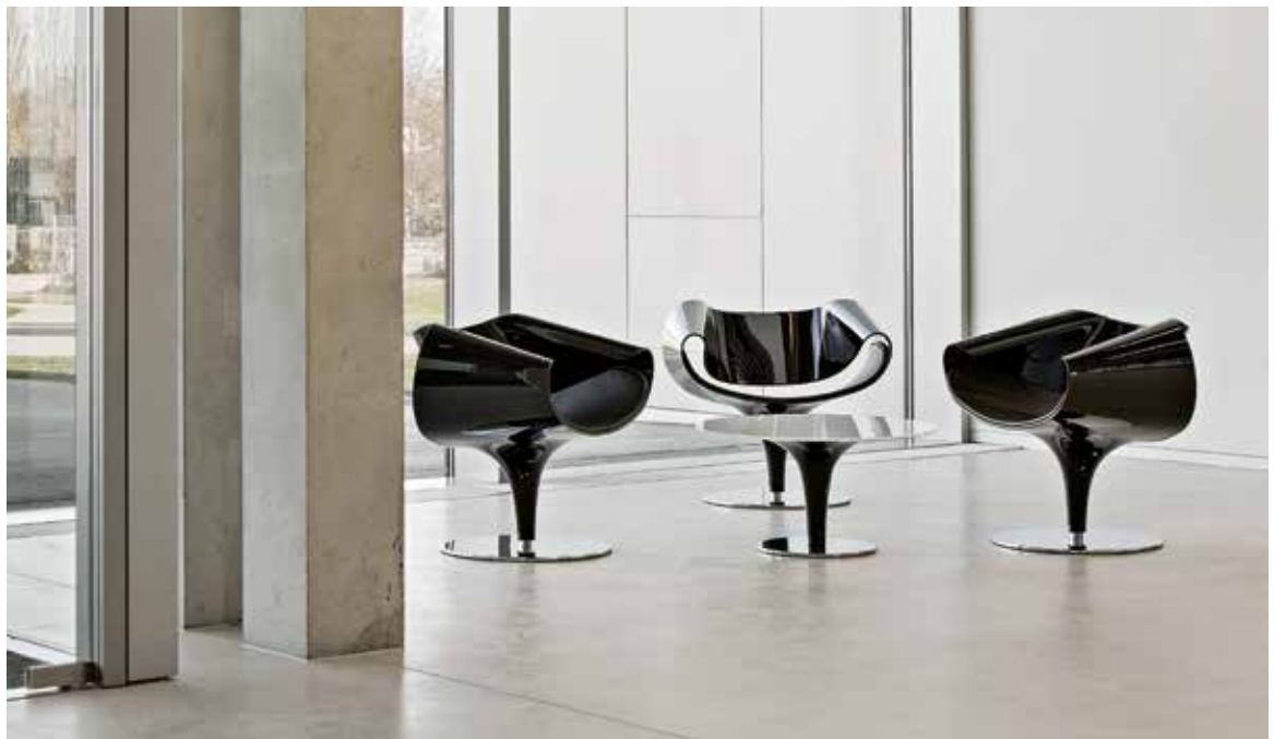
TU München (München, Deutschland) TU Munich (Munich, Germany) Université technique TU München (Munich, Allemagne)