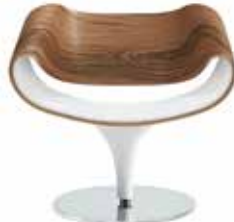
Holz Wood Bois