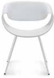
Kunststoff Plastic Polyamide