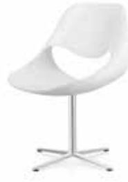
Fusskreuz Cross base Piétement étoile