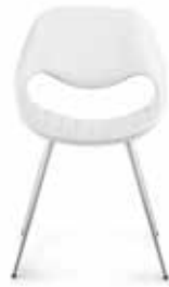
Komplett Leder oder Stoff Full leather or fabric Entièrement en cuir ou en tissu