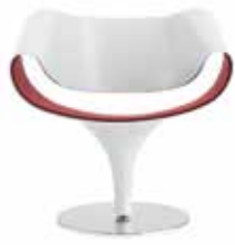
Kunststoff mit Sitzpolster Plastic with seat cushion Polyamide laqué avec capitonnage d'assise