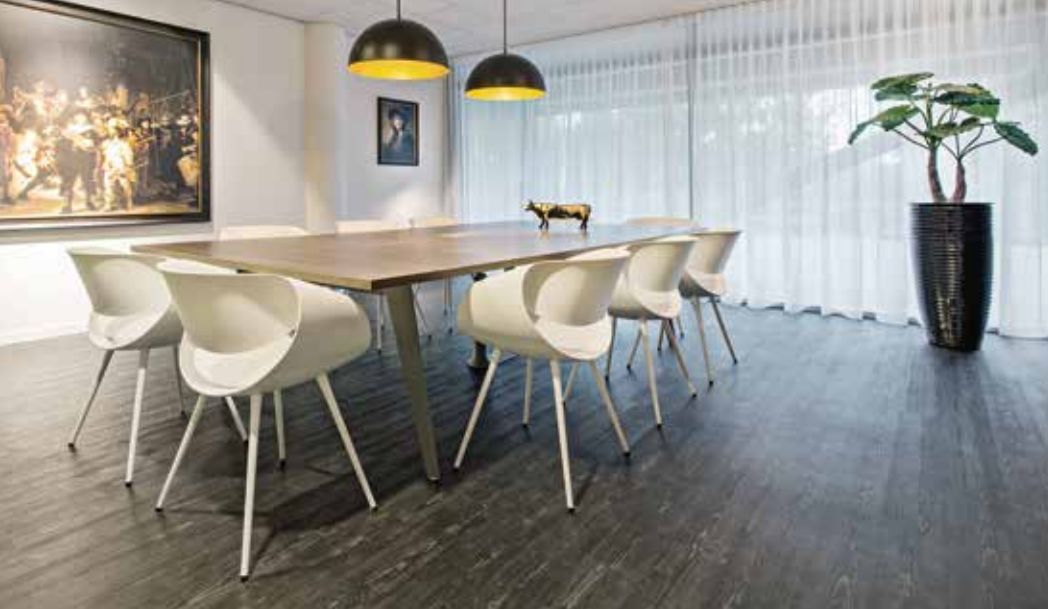
KTBA Kwaliteitszorg BV (Waalwijk, Nederlande) KTBA Kwaliteitszorg BV (Waalwijk, Netherlands) KTBA Kwaliteitszorg BV (Waalwijk, Pays-Bas)