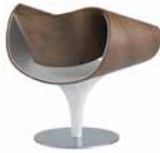
Holz: Rückeninnen- und Seitenteil Wood: backrest inner and side sections Bois: intérieur du dossier et parties latérales