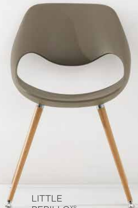
LITTLE PERILLO XS