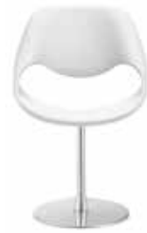
Tellerfuss Circular base Disque