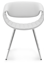
Komplett Leder oder Stoff Full leather or fabric Entièrement en cuir ou en tissu