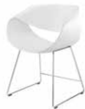
Kufe Skid Traîneau