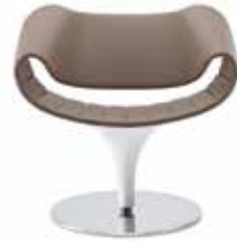
Komplett Leder oder Stoff Full leather or fabric Entièrement en cuir ou en tissu